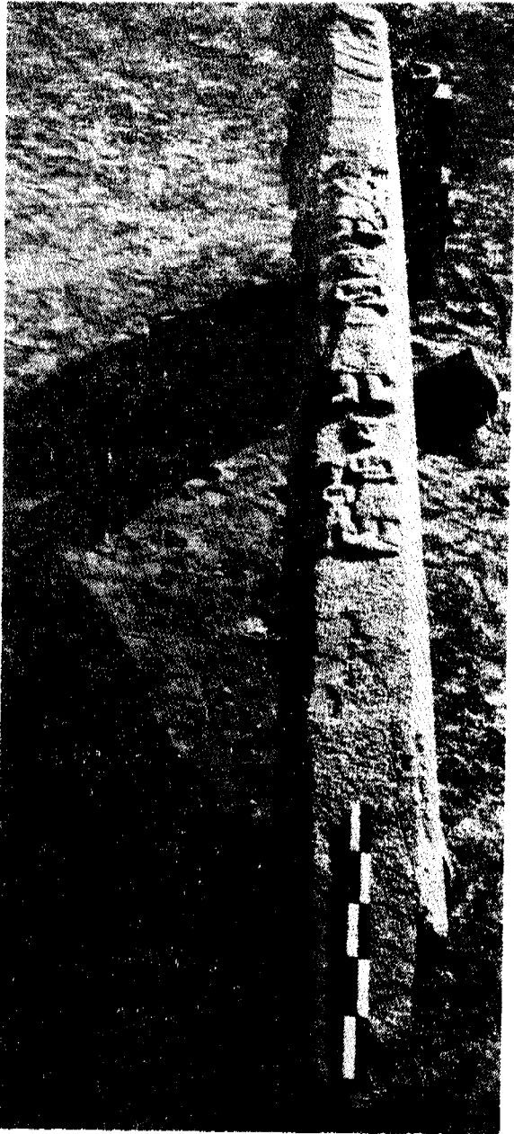
تصویر ۲- یکی از ستونهای بنای سه اطاقه عمارت معبد با نقوش چهارنفر از پیروان

متعلق بدوره پارتها بوده و پس از خراب شدن معبد این قطعات باطراف پراکنده شده بودند . در همان سال نیز توسط ابن هیأت مجسمه‌ای از سر یک مرد را یافتند که در بین قطعات خرد شده مجسمه‌های پرستش کنندگان که احتمالا بوسیله خود آنها بر پا شده بوده بدست آمد. این مجسمه دارای سیل و ریشی شبیه به سبک دوره ناپلئون سوم میباشد . در قسمت پائین پرستشگاه که تاریخ بنای آن نسبت بقسمت بالا جدیدتر است ( سالهای اول میلادی ) یکی از شاهزادگان محلّی ساختمان منفردی شامل سه اطاق مستطیل شکل بنا کرد، که از داخل بیکدیگر راه ندارند. درهای این سه اطاق بایوانی که دارای یک ردیف ستون میباشد باز میشود. در طول این نمازواقی است که سقف آن روی دو ردیف ستون ( هر ردیف مرکب از هشت ستون ) قرار دارد و از این ستونها فقط پنج ستون باقی مانده که همگی دارای اشکال مختلفی