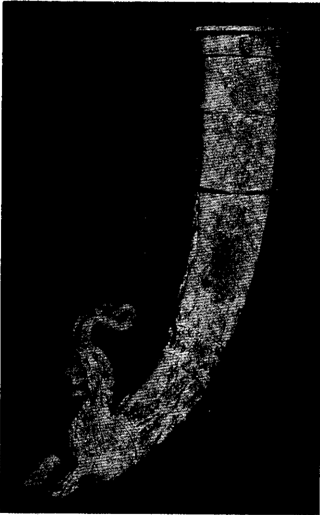
شکل ۴ : ساغر عاج قرن دوم پ - م شکشوفه از نيسا

اثر مهرها، دارای نقوش مختلفی هستند، مانند الهه بالدار، بز کوهی، یا درخت زندگی، آتشدان، اسب سوار، یکی از بزرگان در حال شکار، مردکمان بدست، شکارچی، بزکوهی، و یکی از نجیبای پارتی سوار بر اسب. بی شک هر يك از مهرها تعلق به یکی از شخصیتها داشته که در حدود قرون دوم و اول پیش از میلاد عهده دار