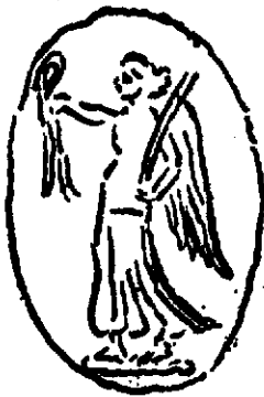
شکل ۶ : طرح مهر