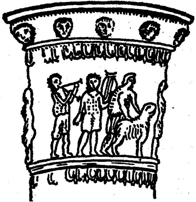
شکل ۵ : قسمتی از نقوشی که بر ساغر عاج کنده کاری شده است (نیسا) بدست آمده در گاوش (نیسا)

حفاظت و حراست خزانه و مخازن و گنجینه ها بوده اند و مهرداران در تحت امر خزانه دارشاهی اجازه داشتند درها را باز و بسته کرده و مهر نمایند (ش : ۶)