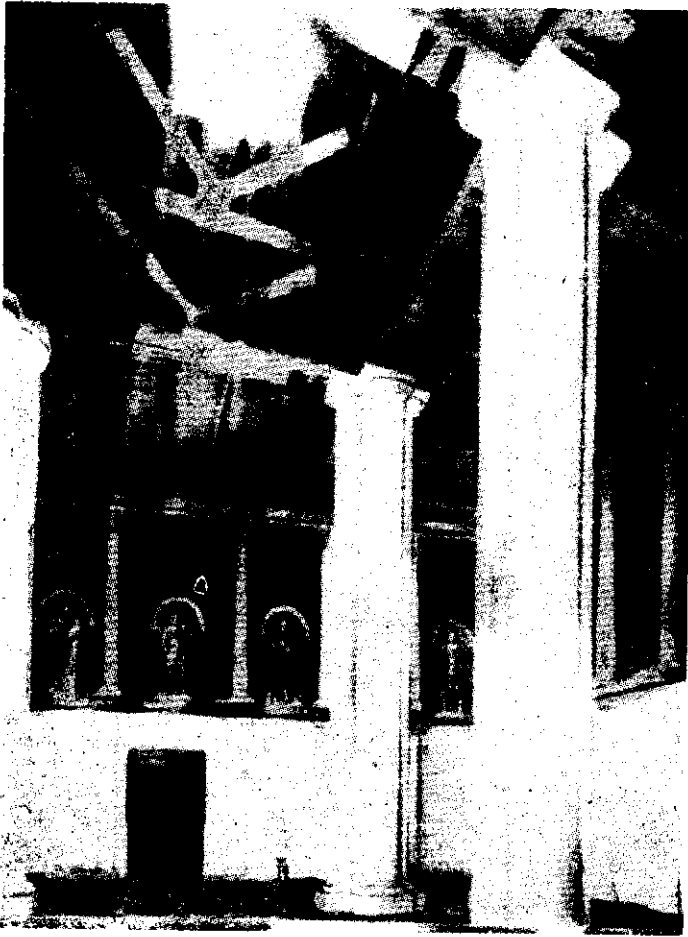
شکل ۱ : کاخ نیسا ، حدود قرن دوم پ - م

تالار مرکزی کاخ بدون تردید چند بار بازسازی شده است و آنچه باقیمانده از قرن اول میلادی است و سقف آن از تیرهای چوبی است که برستونهایی با سرستونهای حجاری شده استوار میباشد . این تالار از سه رواق تشکیل یافته و دیوار تالار دو قسمت است، قسمت بالا دارای طاقچه‌هایی است که جایگاه مجسمه‌های