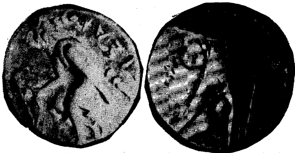
شکل ۷: سکه درهم (سیم) ارشک اول ۲۵۰-۲۴۸ پ - م (مجموعه موزه بانک سپه). از ضرابخانه نیسا

دوره معمولا نام شهرهائی که ضرابخانه در آنها دائر بود بصورت اختصار و یابانوعی علامت مشخصه بر روی سکه بکار رفته است. از ارشک و تیرداد تاکنون چند سکه بدست آمده است که نام نیسا بطور کامل بر سکه نقرگردیده است. از اختصاصات دیگر این پایتخت داشتن دو ضرابخانه است یکی اصلی که ضرابخانه نیسا باشد و دیگری ضرابخانه مهردادکرت، دژ بزرگ و مستحکم شهر که شرح آن گذشت. بامطالعه سکه های پارتیان میتوان دریافت که طی پنج قرن شاهنشاهی آنان همواره مقام بزرگ و والای ارشک اول مؤسس و سرسلسله مدنظر شاهنشاهان بوده و نقش وی بر سکه در حالی که بر تخت نشسته و کمان که مظهر قدرت پارت ها ۵۰ که