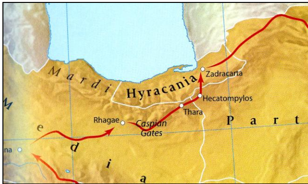
تصویر ۱: موقعیت هیرکانیا در مسیر لشکرکشی اسکندر، براساس گفته‌های مورخان کلاسیک (Barnes, 2007: 55)

اسکندر در راه هیرکانی در نزدیکی شهری به نام «هکاتوم پلیس» اردو زد و بعد از کسب اطلاعات درباره منطقه موردنظر، همراه با سپاهیان‌ش به هیرکانیا وارد شد و تمامی شهرهایی را که در آنجا یافت می‌شد تا دریایی به نام کاسپین (که برخی آن را هیرکانی نیز می‌نامند)، به تصرف خویش درآورد (Diodorus of Sicily, 1963: 333). در واقع، اسکندر با ارتش قوی و دیپلماسی موثر خود توانست به پارس، پارت، باختر، تیوری، هیرکانی، آراخوزیا، سغد و... دست یابد و تمامی این سرزمین‌ها را مطیع خود سازد (Appian, 1955: 209).