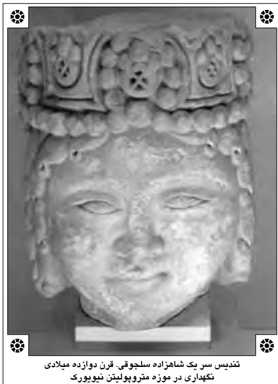
تندیس سر یک شاهزاده سلجوقی. قرن دوازده میلادی نگهداری در موزه متروپولیتن نیویورک

سلجوقی مشکلاتی را برای این حکومت ایجاد نمودند. لذا سلاطین اولیه سلجوقی برای کاهش اتکای خود بر ترکمانان پراکنده نیروی ویژه‌ای از غلامان ترک نژاد تشکیل داده بودند که، حکم ارتش ثابتی را داشت که از غلامان، مزدوران و آزادمدان تشکیل می‌شد. این قشون ثابت، از افراد معمولی تشکیل نشده بود، بلکه اغلب آنان افراد تربیت شده‌ای بودند که می‌توانستند در صورت نشان دادن شایستگی خود، غیر از مقامات بلند نظامی دربار به حکومت ایالات و گاه به مقام اتابکی هم برسند. ۴ راوندی همچنین اشاره می‌کند که، ملک‌شاه در بیرون اصفهان شاه‌دژ را بنا کرد تا جایی برای نگهداری خزانه و سلاح و غلامان تعلیم دیده‌ای باشد که در موقع سفر جنگیش در آنجا محافظت شوند. ۵