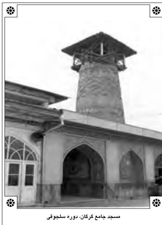
مسجد جامع گرگان، دوره سلجوقی

رشیدالدین فضل الله به کار گرفته شده است. محتویات کتاب تاریخ آل سلجوق شامل چهارده بخش و یک ذیل کوتاه از ابوحامد محمدبن ابراهیم در خصوص خاتمه کار سلطان طغرل است. خواجه رشیدالدین فضل الله در سرآغاز کتاب، دودمان سلجوقیان را معرفی می‌نماید چنان‌چه شیوه معمول وی در دیگر آثار نیز هست. سپس به نحوه شکل‌گیری قدرت و گسترش آنان در نواحی ترکستان و سمرقند و همچنین پیوستگی آنان به غزنویان اشاره می‌کند. ۱۸ در همین قسمت از تاریخ خود به چگونگی شکست سلطان مسعود غزنوی در نبرد دندانقان در اثر اتحاد و یکدلی سلجوقیان اشاره می‌کند. ۱۹