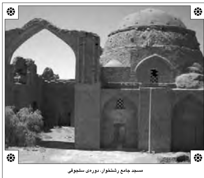
مسجد جامع رشتخوار، دوره‌ی سلجوقی

التواریخ را عظیم‌ترین شاهکار تاریخی که در عصر مغول در ایران به تألیف درآمده و از بزرگترین آثار ادبیات ایران و از مهم‌ترین تواریخ عالم می‌داند که در عهد غازان خان و اولجایتو در تحت اداره وزیر دانشمند خواجه رشید الدین فضل‌الله همدانی فراهم آمده است. ۴ مرحوم زرین کوب جامع التواریخ را جسورانه‌ترین و در عین حال عظیم‌ترین طرح در تاریخ نویسی مسلمانان به زبان فارسی می‌داند و آن را یک نوع همکاری بین‌المللی از سوی مورخان و یک نیای فراموش شده تواریخ امروز کیمبریج می‌شمارد که عظیم‌تر از آن نه در آن زمان به وجود آمد و نه قرن‌ها بعد صورت تحقق به خود گرفت. ۵