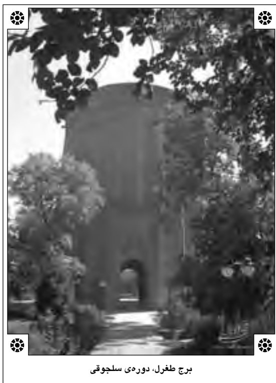
برج طغرل، دوره‌ی سلجوقی

از نکات قابل توجه در این تصحیح مطابقت تاریخ آل سلجوق با سایر کتب تألیف شده درباره سلجوقیان به منظور روشن نمودن کتاب و یا کتاب‌هایی است که احیاناً خواجه و گروه مورخان او از روی آن به نگارش و تدوین پرداخته‌اند. مصحح با مقابله و مطابقت تاریخ آل سلجوق با کتبی چون سلجوق‌نامه اثر ظهیر الدین نیشابوری متوفی به سال ۵۸۲ ه.ق و ذیل سلجوق‌نامه از ابوحماد محمدبن ابراهیم که به سال ۵۹۹ ه.ق تألیف شده و همچنین آثار دیگری چون راحة الصدور وآبہ السرور از نجم‌الدین ابوبکر محمدبن علی بن سلیمان بن محمد