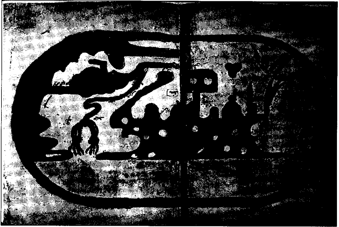
نقشه جهان، از ابن حوقل، از کتاب صورة الارض، قرن چهارم هـ. ق

چهار جهت اصلی بیان می‌دارد و نقشه‌ای از آن سرزمین‌ها ارائه می‌کند. او درباره موقعیت سرزمین فارس می‌نویسد: «از مشرق به حدود کرمان و از مغرب به نواحی خوزستان و از شمال به بیابان واقع در میان فارس و خوزستان و بخشی از اصفهان و از جنوب دریای فارس آن را احاطه کرده است» ۸ .