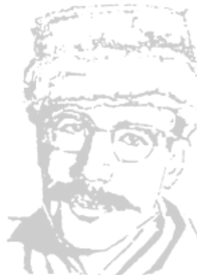
معلم انقلابی رفیق بسند، بهرنگی شاخه دارور ادبیات انقلابی ایران Samad Behranghi