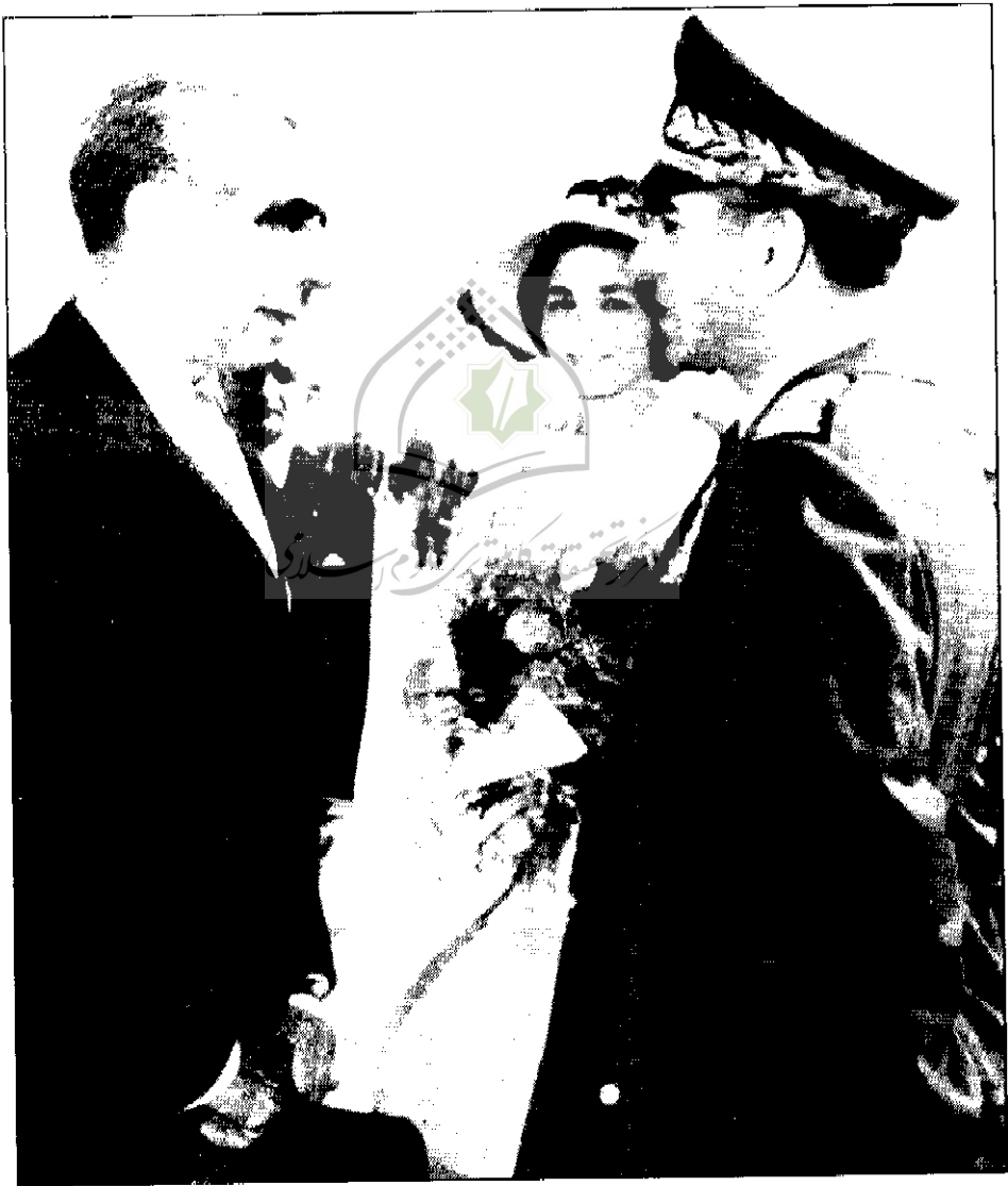
● دکتر امینی در کنار شاه و فرح