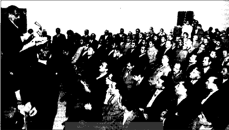
● امینی در جمع طبقات مختلف مردم

کشورهای در حال توسعه و در معرض خطر کمونیسم، و ایجاد زیر ساخت‌های توسعه برای جلوگیری از خطر نفوذ شوروی بود. (۱۷) دموکرات‌ها و کندی، جز سیاست‌های عمومی آمریکا، سیاست‌های ویژه خود را هم داشتند. جان کندی و برادرش، رابرت کندی هر دو، شاه را مستبد و فاسد می‌دانستند. (۱۸) جان، با روش‌های شاه مخالف بود و با فساد که در دستگاه اداری ایران رخنه کرده بود آشنایی داشت و ضرورت اصلاحات در ایران را خوب حس می‌کرد. (۱۹) به گفتهٔ ارمین میر ۱ که سفیر آمریکا در ایران شد، حکومت کندی دربارهٔ ایران بی‌اندازه نگران بود و به محض آن که بر سر کار آمد، به فوریت گروه‌های مامور در ایران را تشکیل داد. (۲۰) کندی کمیتهٔ ویژه‌ای هم برای ارزیابی سیاست آمریکا در ایران تشکیل داده بود که نمایندگان از سازمان‌های دولتی آمریکا در آن عضویت داشتند. ریاست کمیته با فیلیپ تالبت ۲ بود. کمیته، مامور بود اوضاع و احوال ایران را از دیدگاه سیاست‌های آمریکا تحلیل کند و با توجه به دیکتاتوری شاه، که کشور را به ورطهٔ خطرناکی کشیده بود، راه حل مناسبی پیشنهاد دهد. اما گفته شده است که از صورت جلسه‌های این کمیته این طور بر می‌آید که میان اعضا اختلاف نظر وجود داشته است. عده‌ای طرفدار برکناری شاه و عده‌ای دیگر خواستار حفظ او، اما وارد آوردن فشار بر وی برای تن