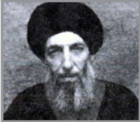
آیت‌الله محسن حکیم