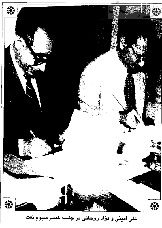
علی امینی و فؤاد روحانی در جلسه کنسرسیون نفت

این شمه‌ای از زندگی امینی است که با تفصیل بیشتر در کتاب بربال بحران درباره آن سخن رفته و جزئیات زیادی از زندگی خصوصی و سیاسی وی در معرض خوانش عمومی قرار گرفته است. ایرج امینی، در ابتدای کتاب می‌نویسد که پس از فوت پدرش، «به یادداشت‌های ایشان دست‌یافتیم که از سال ۱۳۵۳ تا چند هفته پیش از انقلاب اسلامی نوشته شده بود. امیدوار بودم که با خواندن این یادداشت‌های روزانه، به سوالات متعددی که درباره عقاید، اهداف و اعمال سیاسی ایشان مطرح بوده است و هم‌چنین بعضی نکات تاریک تاریخ معاصر ایران پی ببرم. متأسفانه سواى