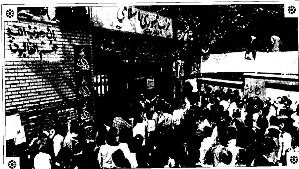
عزاداری مردم در سوگ شهدای هفتم تیر ۱۳۶۰

موافقان حزب) دیدگاه سایر احزاب درباره‌ی این حزب نیز از جمله اخبار مهم تلقی می‌شود: احزابی که دیدگاهی اسلامی داشتند، با حزب