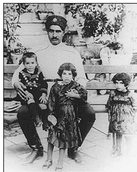
رضا شاه و فرزندانش؛ از سمت راست اشرف، شمس و محمدرضا

جبروت سلطنتی عاریتی به دشواری تحقق پذیر است. خانواده های سلطنتی برای احتراز از این معضل، شاهزادگان را حتی الامکان از انظار عمومی دور نگه می دارند، زندگی شاهزادگان را در پرده ای از رمز و راز و جلال و جبروت درمی پیچند و نمی گذارند رعیت دولت، حاکم قدر قدرت آینده را در حالتی عاری از هاله قدرت و جلال درباری رؤیت کند.