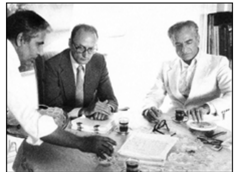
شاه در حال نگارش کتاب پاسخ به تاریخ

"مأموریت برای وطنم" از سوئی پر از تمجید و تکریم رضاشاه است و به روایتی، یکسره در سایه پدر نوشته شده است. در بلندی این سایه همین بس که در متن انگلیسی سیصد و هشتاد و پنج صفحه ای، کتاب نزدیک به پانصد بار از رضاشاه یاد شده است.