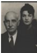
1933-1 ع رضاشاه و اشرف پهلوي در ايام تبعيد در ژوهانسبورگ