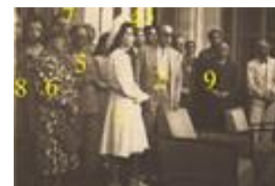
1352- 11 ع