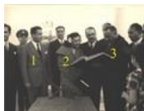
1346- 11 ع