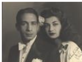
2071-11 ع اشرف پهلوي و همسر دومش احمد شفيق