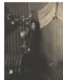
1364-11 ع اشرف پهلوي