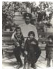
62-144 ق از راست: اشرف، شمس، رضاخان سردار سپه و محمدرضا پهلوي (1301)