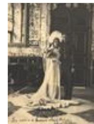
1360-11 ع اشرف پهلوي و علي محمد قوام در روز ازدواج