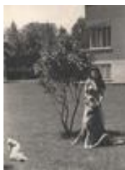
1361-11 ع اشرف پهلوي به همراه سگ دست‌آموز خود، در محوطه يکي از کاخهاي سلطنتي