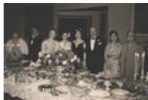
63-554 الف اشرف پهلوي در سفر به مصر، در ميان اعضاي خانواده سلطنتي اين کشور ۱. اشرف پهلوي ۲. ملك فاروق (پادشاه مصر) ۳. فائزه (خواهر فوزيه 4. فوزيه (همسر اول محمدرضا پهلوي)