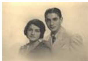
1044-11 ع محمدرضا و اشرف پهلوي