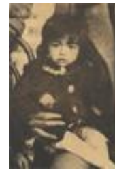
4720-4 اشرف پهلوي