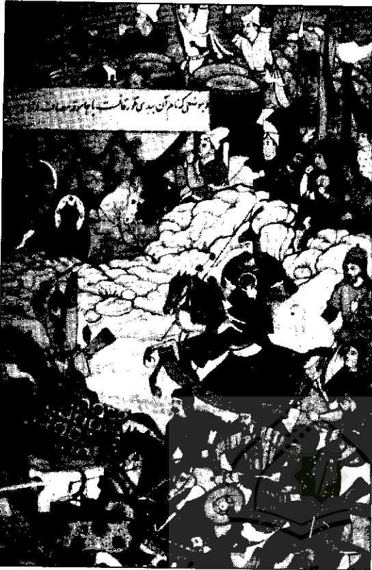
صحنه‌ای از نبردهای سربازان چنگیزخان، از کتاب مینیاتورهای ایرانی، کتابخانه سلطنتی نیویورک

نظریه «اسناد» در روانشناسی اجتماعی و روانشناسی یادگیری، مکانیزمی از یادگیری است که انسان در تجربه‌های خود آن را خواه نا خواه به کار می‌برد. این نظریه اولین بار در سال ۱۹۵۸ / ۱۳۳۷ توسط «هاید» ارائه شد