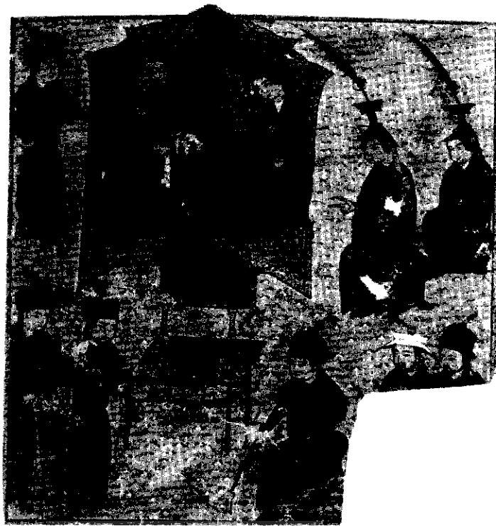
دربار ایلخان غازان، قسمتی از یک مینیا تورا ایرانی

تردیدهایی وجود دارد، چراکه هیچ دلیلی که نشان دهنده ارتباط آن با گزارش تاتار باشد، وجود ندارد. ۸ همچنین ترجمه جدیدی از سفرنامه ویلیام روبرگی فرانسویسکن که در سال‌های ۵-۱۲۵۳ م. به عنوان هیأت مذهبی از مغولستان دیدن کرده، در دست داریم. ۹ این که ترجمه‌های انگلیسی وقایع نگاری‌های دوارمنی، گیراکوس گنجهای (م. ۱۲۷۲) و واردان آراولسی (م. ۱۲۷۰) که در طی اولین دهه‌های تسلط مغولان زندگی می‌کردند، را در اختیار داشته باشیم، بسیار سودمند است. ۱۰ ترجمه تفسیری از تنها منبع روایی موجود به مغولی بانام تاریخ سری مغولان که در سال ۱۹۸۶ به وسیله ایگور دراچویلتز کامل شده بود. ۱۱ هنوز انتشار نیافته است. تا این کار صورت بگیرد. می‌توان از تاریخ و زندگی چنگیز خان اثر اورگان اونون (لیدن ۱۹۹۰) استفاده کرد که ترجمه انگلیسی آن را بسیار آسان‌تر می‌توان به دست آورد. هر چند که با اولین اثر محلی مغولان تفاوت دارد.