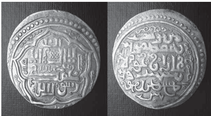
دو سکه ضرب شده در زمان غازان خان، تبریز

این کتاب تاریخ عمومی است و به تقلید از مجلد دوم تاریخ عام جامع التواریخ خواجه رشیدالدین و به نام غیاث الدین محمد، فرزند خواجه رشیدالدین، در سال ۷۳۰ هـ. ق. به تألیف درآمد. این کتاب به طور مختصر، آفرینش کائنات، ذکر پیامبران، تاریخ پیش از اسلام، تاریخ اسلام و ایران تا زمان حیات مؤلف را دربرمی گیرد. مؤلف از کتاب‌های تاریخی چون: سیر النبی، قصص الانبیاء، رسالت‌قشیریه، تذکره‌الاولیاء، التدوین امام رافعی، تجارب الامم، مشارب التجارب، ایران النسب، تواریخ محمد بن جریر طبری، تاریخ حمزه اصفهانی، تاریخ کامل ابن اثیر، زبده التواریخ جمال الدین ابوالقاسم کاشی، نظام التواریخ قاضی بیضاوی، عیون التواریخ بغدادی، تاریخ جهانگشای جوینی، شاهنامه فردوسی طوسی و جامع التواریخ رشیدالدین فضل‌الله همدانی نام می برد که در نگارش تاریخ کهن از آن‌ها بهره گرفته است و در آخر متذکر می شود که این کتاب به دلیل گزینش مطالب از کتاب‌های فوق‌الذکر،