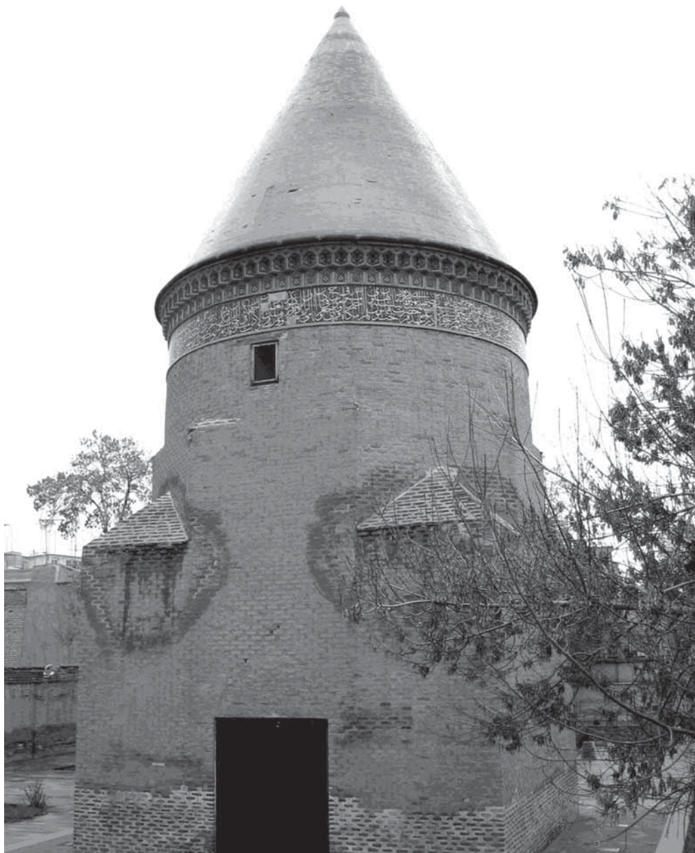
آرامگاه حمدالله مستوفی، قزوین