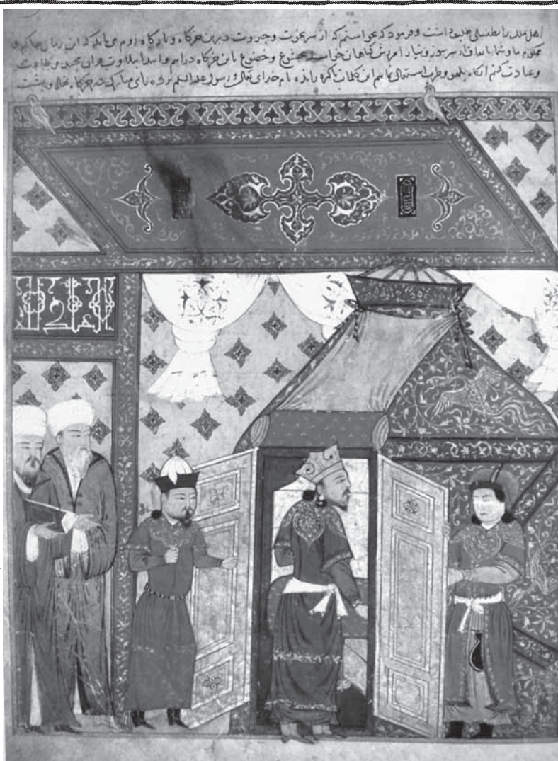
اسلام آوردن غازان خان در کتاب جامع التواریخ

تشریف غازان به دین اسلام نشان می‌داد که اوضاع تغییر کرده است و این خود تکاملی بود که می‌رفت تا صورت گیرد؛ هر چند تغییر دین جدید می‌توانست تا حد زیادی سیاسی باشد. او ضمن تقویت اسلام، به تضعیف سایر ادیان پرداخت. حتی دارای