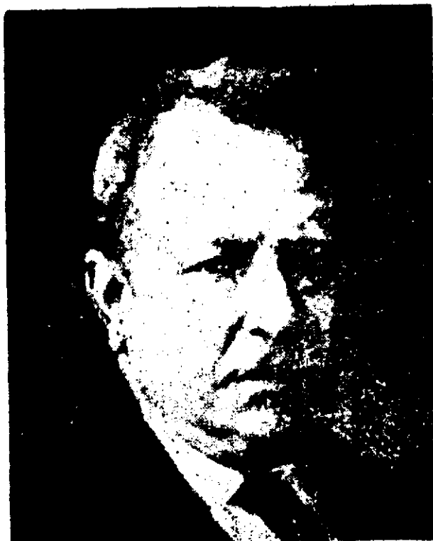
● بند توکروچه

چیزهای واقعی متعددی که آن نامها تداعی می‌کنند، فکر کنیم. به این جهت، محتوای آنها نامتعیین است، و این عدم تعین به معنای تهی بودن آنهاست.