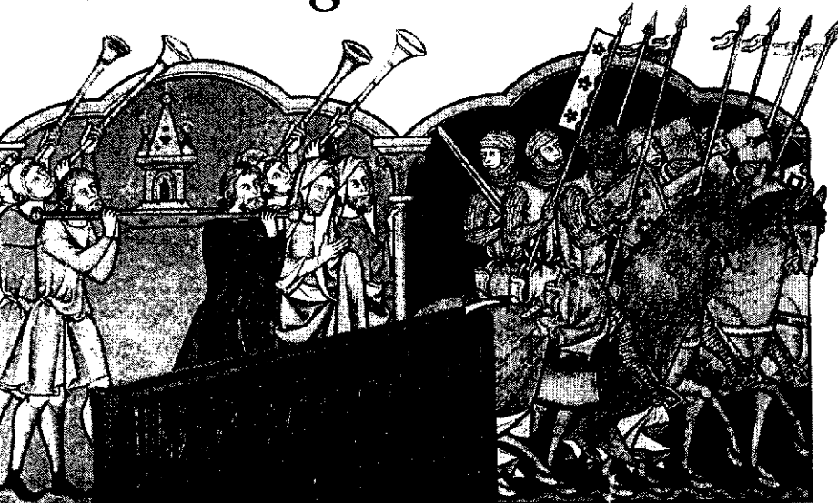
The Picture Bible of Saint Louis

می‌دارد و تمغا و مال و اخراجات ۱۲ او را معاف می‌دارند و داوود ۱۳ که این منادی شنید گفت من او را خواهم کشت برادرانش منع کردند که تو این عادی جکونه ۱۴ میکشی و پادشاه به داوود گفت که تو این عادی را چون میکشی گفت بتوفیق خدای او را می‌کشم بعد از آن از پادشاه رخصت طلبید که بجنگ رود و پادشاه ساول ۱۵ به دست خود لباس جنگ بر داوود پوشانید و او را تنها بجنگ فرستاد و حضرت داوود به لباس جنگ عادت نکرده بود از سر بیرون کشید و عصای خود را به دست گرفت و بکنار رودخانه رسید سنگی چند برداشت و حربه که همراه داشت قلماسنگ ۱۶ بود که انرا از ریسمان تهیه کرده بودند و با آن سنگها متوجه میدان جنگ شد ۱۷