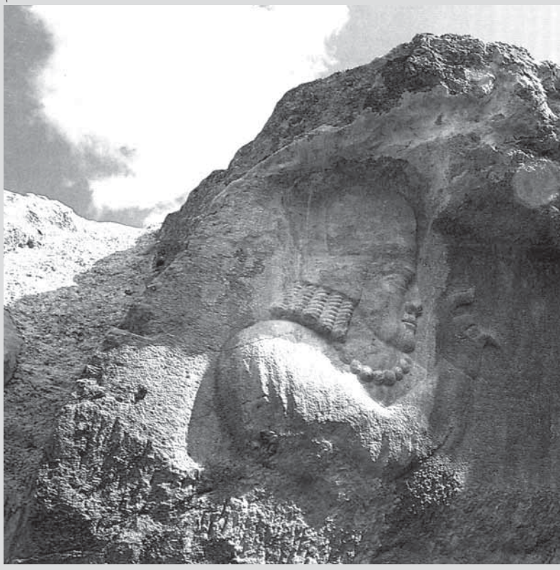
کرتیر. نقش رستم

در قانون نامه «ماتیگان هزار داتستان»، انواع قرار دادها، معاملات و حل معضلات مربوط به آن‌ها، طبق شرایط متعدد از جمله شرایط رسیدن کشتی به لنگرگاه، وجود کالا در کشتی و حمل آن به محل فروش، درج شده است