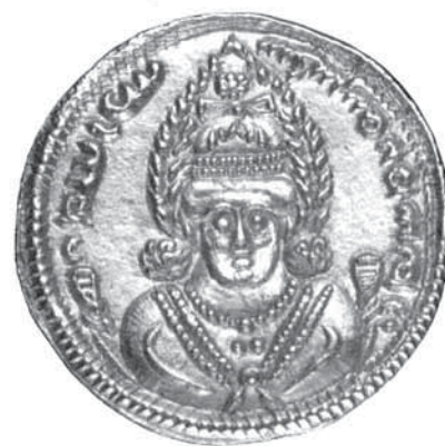
سکه خسرو پرویز