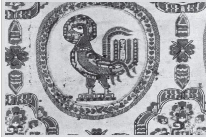
پارچه. دوره ساسانی

شاهنشاه به شمار می‌رفت، اما در آزادی ناتمام، تنها بخشی از برده آزاد می‌شد. برای مثال، اگر برده‌ای آزادی یک دهم داشت، چنان‌که فرزندی از او متولد می‌شد، آزادی این فرزند نیز در همین حد یک دهم بود [همان، ۲۷].