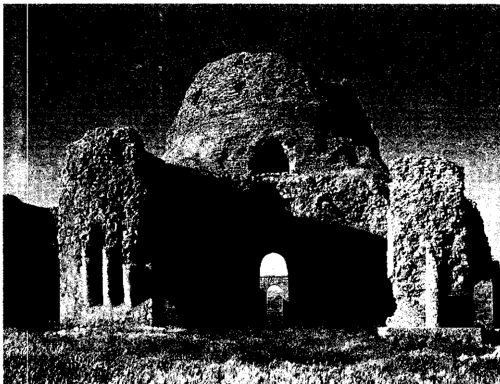
سوسان - قصر سامان - دوره ساسانی

G.Morgenstierne, An Etymological Vocabulary of Pashto (Oslo, 1927), p. 48. →