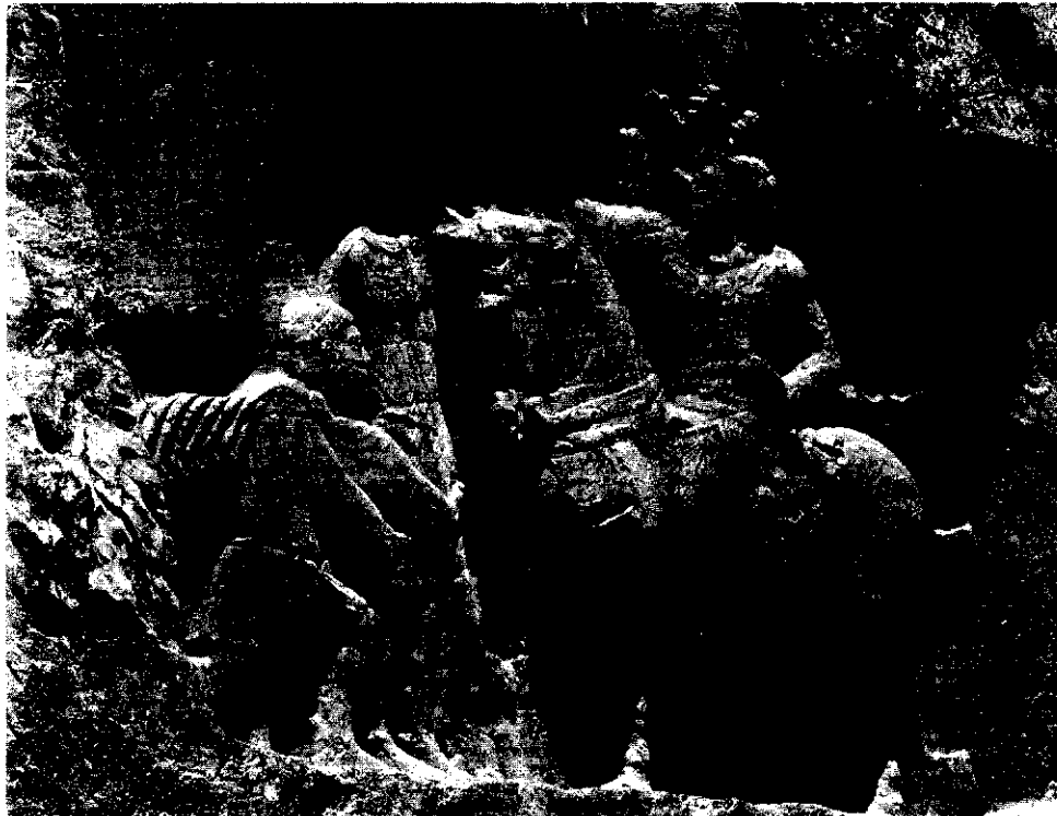
فارس - نقش رستم - حطاب بخشش والین امیر بطور روم از شاپور اول ماسدی

مهرها که جزء نام‌شناسی نیستند و ترتیب زمانی نوشته‌ای باستانی [خط شناسی] است. دشواری همیشگی چگونگی املاء بسیاری از این واژه‌هاست؛ مثلاً: آیا به راستی واژه veh دو معنای متفاوت یکی از ریشه vahyah - «بهتر» و دیگری vaidya : «فرزانه» دارد؟ گرچه قرائت wyd در چند مثال کاملاً واضح است مثل «وه - بندگان» (vehbandag)؛ «بنده دانا»، اما سخت است بپذیریم که نام‌های wyhgwnsp, Wydbwic'twl و whrmzd > wyd از نام‌های