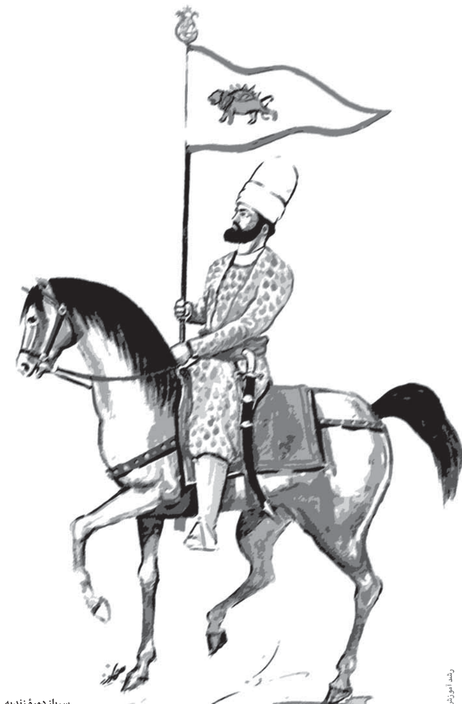
سرباز دوره زندیه

چون یک سر زنجیری که قایق‌های پلی را نگه داشته بود، در خاک ایران به میخ‌ها و ستون‌های بزرگ و محکم بسته شده بود، و سر دیگر آن باید در ساحل مقابل بسته می‌شد، نیاز به شناگران ماهر و با جرئتی نیاز بود تا با عبور از آب خروشان اروند، این اقدام را عملی کنند. در این جا بود که شجاعت بختیاری‌ها و مهارت‌های خاص آنان که لازمه زندگی کوچ‌روی آنها بود، به کار آمد. به گزارش منابع عصر زندیه، بختیاری‌ها نقش مهم و مؤثری در ساختن پل و عبور سپاه ایران از اروند رود و رسیدن به بصره داشتند. آنان با استفاده از مشک‌های پر از هوا و مهارت در شناگری، به آسانی از رود گذشتند و در آن سوی آب منتظر رسیدن مصالح لازم برای احداث پل شدند. پس از پایان عملیات احداث پل که حدود ۱۸