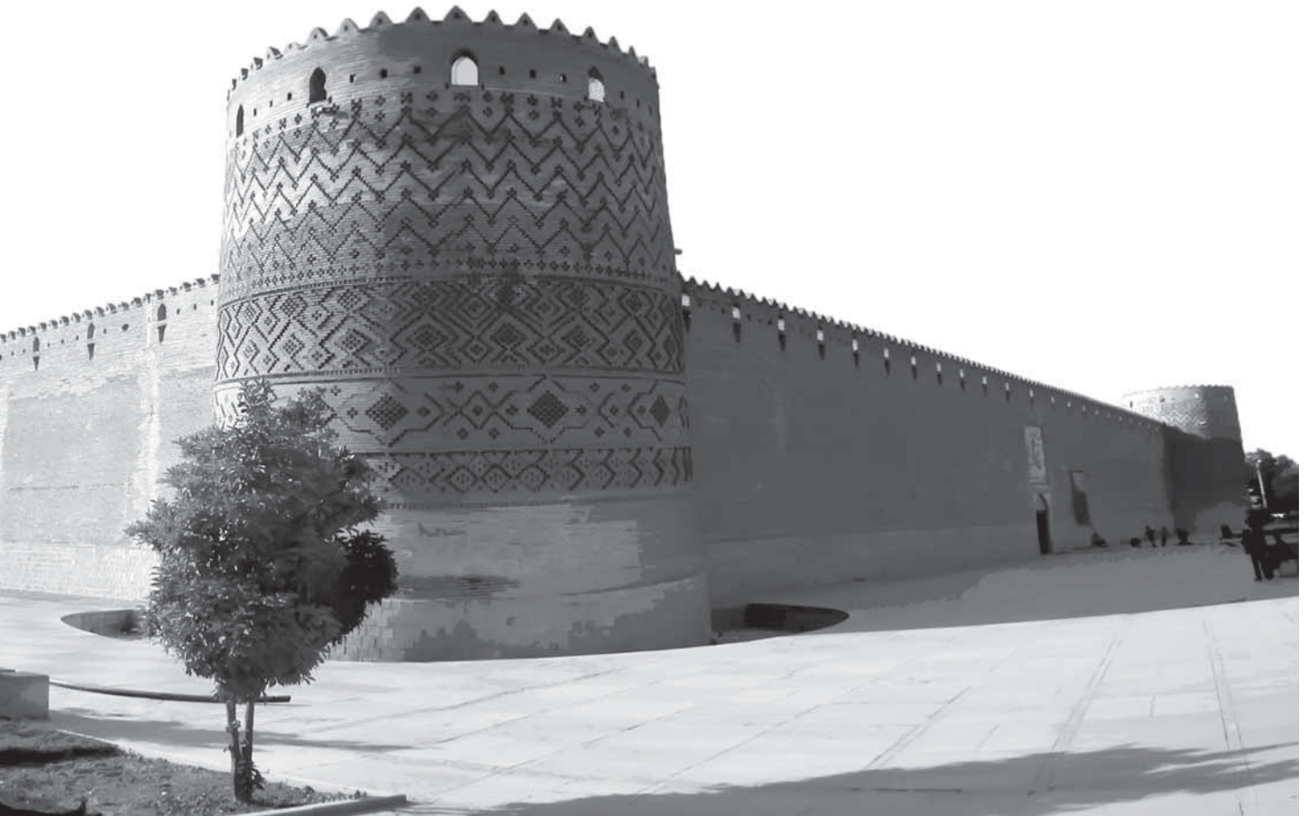
ارگ کریم خان، شیراز

در هر حال باتوجه به دلایلی که ذکر کردیم، کریم‌خان «تدمیر عمرپاشا و تسخیر اُم‌البلاد بصره و دارالسلام بغداد و سایر ولایات تابعه او را پیشنهاد همت والا فرمودند.» و چون از رفت و آمد سفرها نیز نتیجه‌ای حاصل نشد، خان زند سپاهی بزرگ را به فرماندهی برادرش صادق‌خان مأمور تصرف بصره کرد.