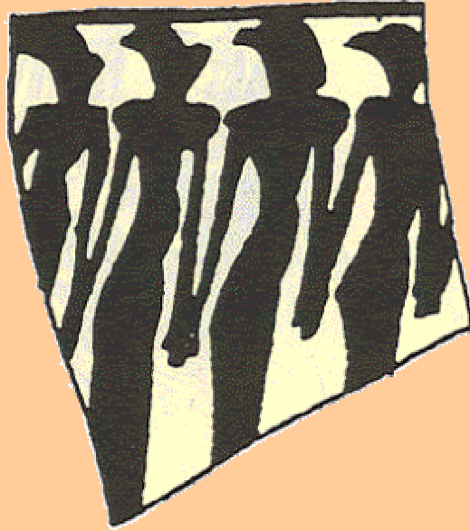
ننگاره ۶ : ملکه مادر - از گل اولین هزاره قبل از میلاد - شوش.