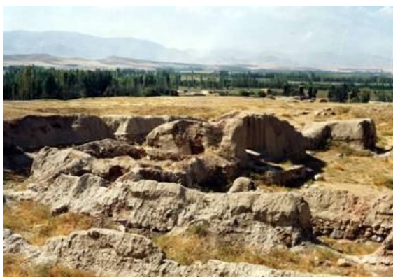
نمای تپه حسنلو