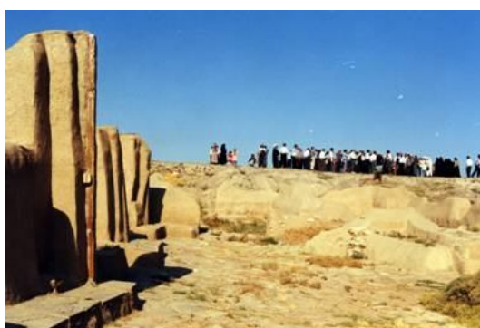
نمای تپه حسنلو

در این شهرستان، علاوه بر موارد فوق تپه‌های تاریخی ذیل نیز قابل اشاره می‌باشد.