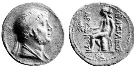
فرهاد دوم نوع ۱۴/۱ سلوود

اما در چهاردرهمی‌های نوع ۱۴ سلوود متعلق به فرهاد دوم، تصویر آپولو نشسته بر اومفالوس جایگزین تصویر ارشک کماندار می‌شود. این نقش به طرح سکه‌های سلوکی شباهت دارد. ضرب این سکه‌ها را می‌توان به دورانی نسبت داد که فرهاد دوم برای رویارویی با آنتیوخوس هفتم ۱ (۱۲۹ پ.م - ۱۳۸ پ.م)، درصدد جلب حمایت مهاجرنشین‌های یونانی ایالت ماد بود. ۲