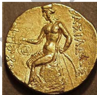
سکه‌های آنتیوخوس اول (۲۶۱-۲۸۱ پ.م)

بنابر این، تصویر اشک اول یا کماندار نشسته بر اومفالوس در سکه‌های مهرداد اول، آن گاه که با پیشرفت‌های نظامی و سیاسی وی در رویاروی با سلوکیان مد نظر قرار می‌گیرد؛ ۶ از