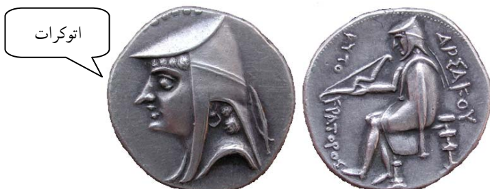
اشک اول، نوع ۲/۱ سلوود ضرب احتمالی نیسا

نقش فرماندار بر پشت درهم‌های دوره اشکانی به جز دوران ونن اول (۸-۱۲ م.)، به سمت راست است. نمای کلی این طرح به سکه تارکامووا ۱ شهرت / ساتراپ هخامنشیان در تارسوس ۲ و کاپادوکیه، ۳ شباهت دارد که در قرن چهارم پ.م ضرب شده است. ۴ طرح کلاه، شال روی شانه و طرح اورنگ و کمان کاملاً یکسان است؛ بنابراین برخی محققان این شباهت را تصادفی نمی‌دانند و معتقدند طرح سکه‌های ارشک احتمالاً اقتباسی از سکه‌های تارکامووا است. ۵