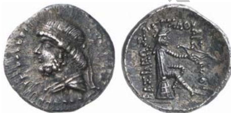
نوع ۱۵/۲ سلوود

در درهم های فرهاد دوم نیز نقش اشک اول جایگزین آپولو می شود که در واقع بازگشتی به طرح آغازین پشت سکه های اشکانی است، اما اشک در جهت مخالف تصویر آپولو و همانند سکه های مهرداد اول طراحی شده است.