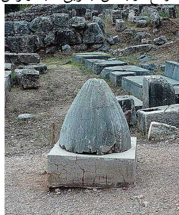
سنگ اومفالوس در گورستان دلفی