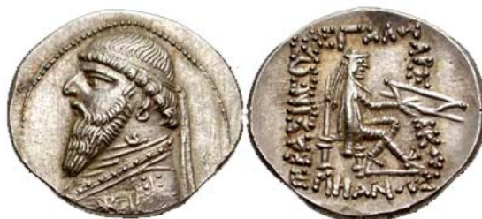
مهرداد دوم، نوع ۲۶ سلوود

نکته شایان توجه این است که در سکه‌های مهرداد دوم، نوع ۲۶ که تصویر سالخورده او را به نمایش می‌گذارند، تصویر اومفالوس از سکه‌ها حذف و نقش اورنگ یا تخت سلطنت، مشابه طرح سکه‌های آغازین ارشک اول، جایگزین آن می‌شود. در این سکه، مهرداد دوم علاوه بر کمان یک تیر هم در دست دارد.