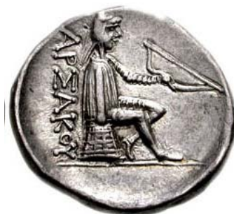
مهرداد اول، نوع ۷/۱ سلوود

دست بر پشت سکه‌ها، نقش بسته است؛ اما اینک اشک اول یا کماندار به جای اورنگ، نشسته بر اومفالوس ۱ مجسم شده؛ که طرحی برگرفته از سکه‌های سلوکی است.