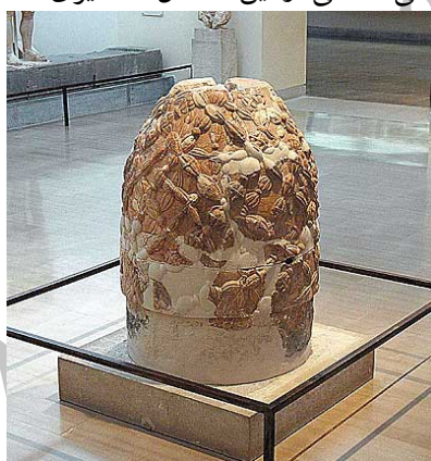
نمونه رومی اومفالوس در موزه دلفی

بر طبق اساطیر یونانی، اومفالوس سنگی است که نشان دهنده مرکز جهان و محلی که ایزد یونانی، آپولو، ۲ (ایزد عقل، نور، حقیقت و پیشگویی)، ۳ پیتون، ۴ ازدهای دلفی، ۵ را از بین برد و معبد خود را بر آن بنا نهاد. ۶ سنگ آیینی یا اومفالوس، به دست آمده در نزدیکی گنجینه بوئتیا، ۷ واقع در بخش جنوبی معبد زئوس در دلفی، نشانی از این داستان اساطیری است.