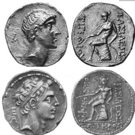
به ترتیب از راست به چپ: سکه اوکوناپسس، سکه تیگرائیوس، ضرب شوش

طرح آپولو نشسته بر اومفالوس در سکه‌های حکام الیمایی نیز به کار رفته است. ۱ از جمله سکه‌های کامنسکیرس دوم نیکه‌فوروس ۲ (۱۴۵-۱۳۹ پ.م)، اوکوناپسس ۳ (حدود ۱۳۹ و ۱۳۸ پ.م)، تیگرائیوس ۴ (حدود ۱۳۲-۱۳۸ پ.م) و داریوش ۵ (حدود ۱۲۹ پ.م). در این سکه، تصویر آپولو نشسته بر اومفالوس با کمانی در دست چپ و تیری در دست راست به چشم می‌خورد. محدوده زمانی ضرب این طرح، در سکه‌های حکام الیمایی با دوران حکمرانی فرهاد دوم (۱۲۷ پ.م-۱۳۸ پ.م)، همزمان است. در واقع، این طرح ابتدا در سکه‌های کامنسکیرس دوم شناسایی شده است و چنین به نظر می‌رسد که فرهاد دوم این طرح را از سکه‌های او اقتباس کرده است.