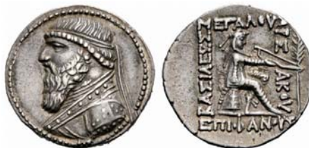
مهرداد دوم، نوع ۲۴ سلوود

در سکه مهرداد دوم، نوع ۲۴ سلوود، طرح شاخه نخل به نقش فرماندار نشسته بر اومفالوس افزوده شده است که کمابیش طرح سکه نوع ۱۸/۲ سلوود را تداعی می کند؛ با این تفاوت که فرماندار جایگزین آپولو شده است. چنین سکه هایی در سلوکیه ضرب شده اند.