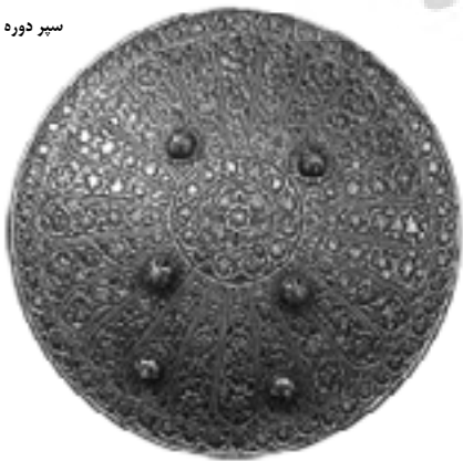
سپر دوره زندیه

با وجود شهرت بین المللی شمشیرها و جنگ افزارهای ایرانی، مطالعه و تحقیق پیرامون آنها در ایران بسیار اندک است. به سختی می توان تحقیقی مفید درباره تاریخ و توسعه جنگ افزارها به زبان فارسی یافت. از طرف دیگر، مطالبی که پیرامون جنگ افزارها و سلاح های ایرانی در غرب منتشر شده، تنها به عنوان یک مقوله ای تحت عبارت کلی «جنگ افزارها و سلاح های اسلامی» آمده است.