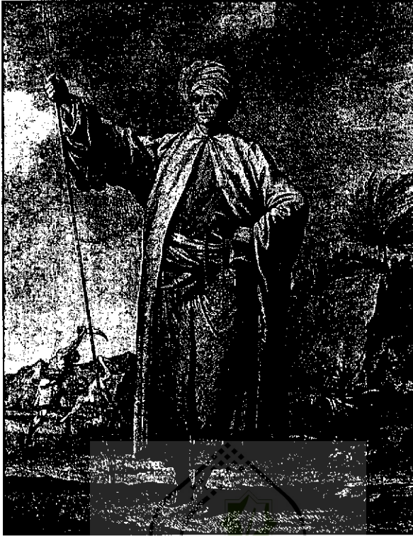
● کارستن نیبر (1733-1815) Gaarsten Niebuhr