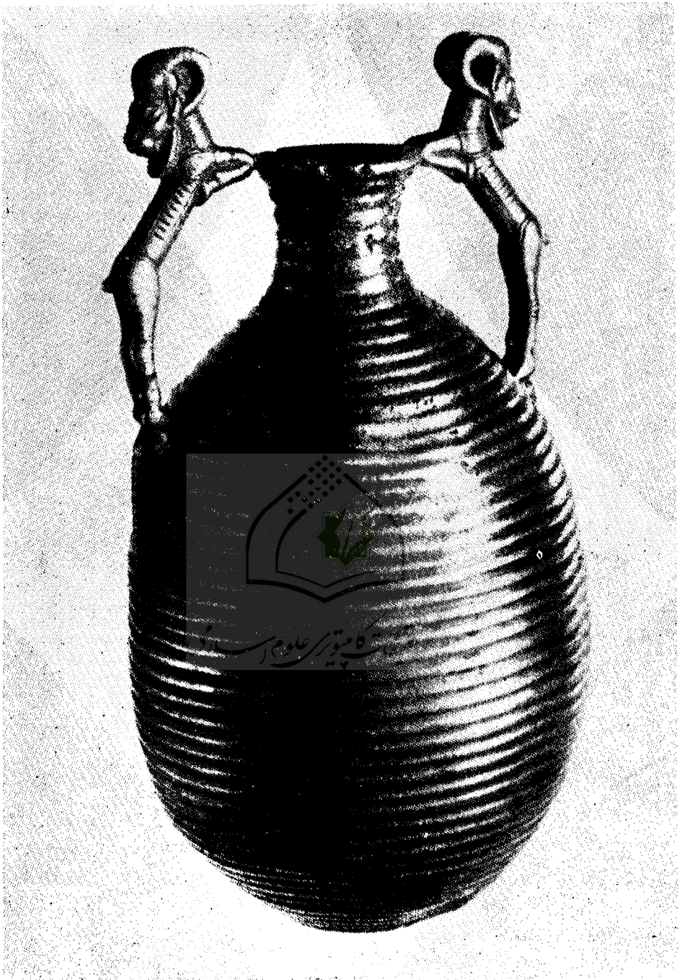
شکل ۶- گلدان نقره‌ای شبیه بکوزه تخم مرغی شکل با شیارهای افقی و موازی مربوط به هنر مخامشی در موزه ایران باستان تهران