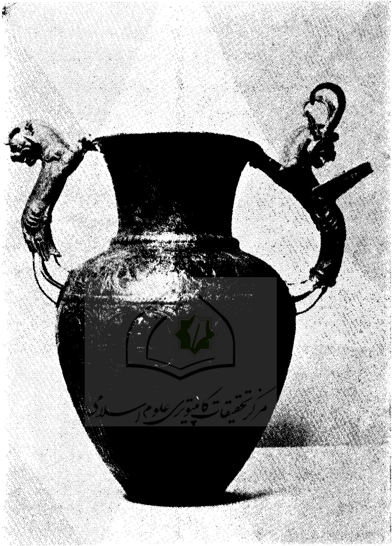
شکل ۱ - گلدان نقره‌ای مربوط به هنر هخامنشی در موزه ملی باستانشناسی صوفیه ( بلنارسنستان ) عکس از نگارنده .