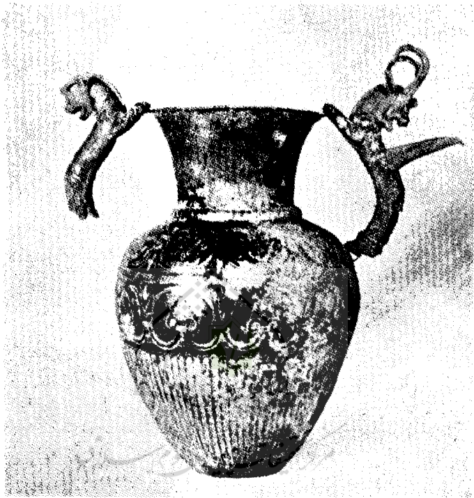
شکل ۲- همان گلدان نقره‌ای قبل از تعمیر دو سال ۱۹۳۸