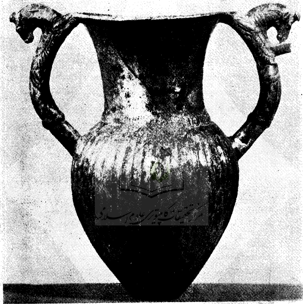
شکل ۵ - گلدان نقره‌ای مربوط به هنر هخامنشی متعلق به مجموعه خصوصی پال (سوئیس) عکس از

Kunstschatze aus Iran, Wien 1963, p. 87 katalog 363.