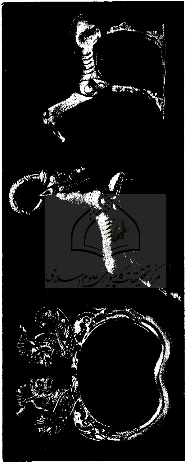
شکل ۸ - سه اثر از کتیبه جیوتون دو موزه بریتانیا (لندن) مربوط به هنر هخامنشی