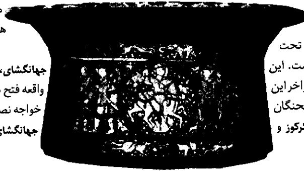
طشت برنجی معروف به طشت غسل تممید، ساخت مصر یا

در بعضی از نسخه‌های تاریخ جهانگشای، در آخر جلد سوم، فصلی در شرح واقعه فتح بغداد به دست هولاکو، تألیف و خواجه نصیرالدین طوسی، به عنوان ذیل جهانگشای، ضمیمه گردیده است. ۲۱