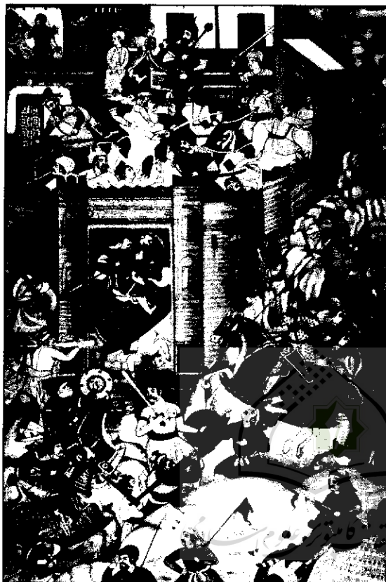
استحکامات اطراف شهر مانعی برای پیشروی جنگجویان مغولی، از نسخه خطی جامع التواریخ، کتابخانه سلطنتی نیویورک

تاریخ مغولان از نظر تاریخ جهانی در حد فاصل دنیای کهنه و نو قرار دارد. بخش پایانی قرون وسطی در بردارنده تاریخ مغولان است و آنان به طور غیر مستقیم در شکل‌گیری دنیای نو با مقدمه‌ای چون اکتشافات جغرافیایی نقش داشته‌اند. برای تاریخ ایران نیز مغولان در پایان عصری قرار می‌گیرند که پس از آن دوره‌ای جدید با شرایطی جدید یعنی صفویان قرار دارند