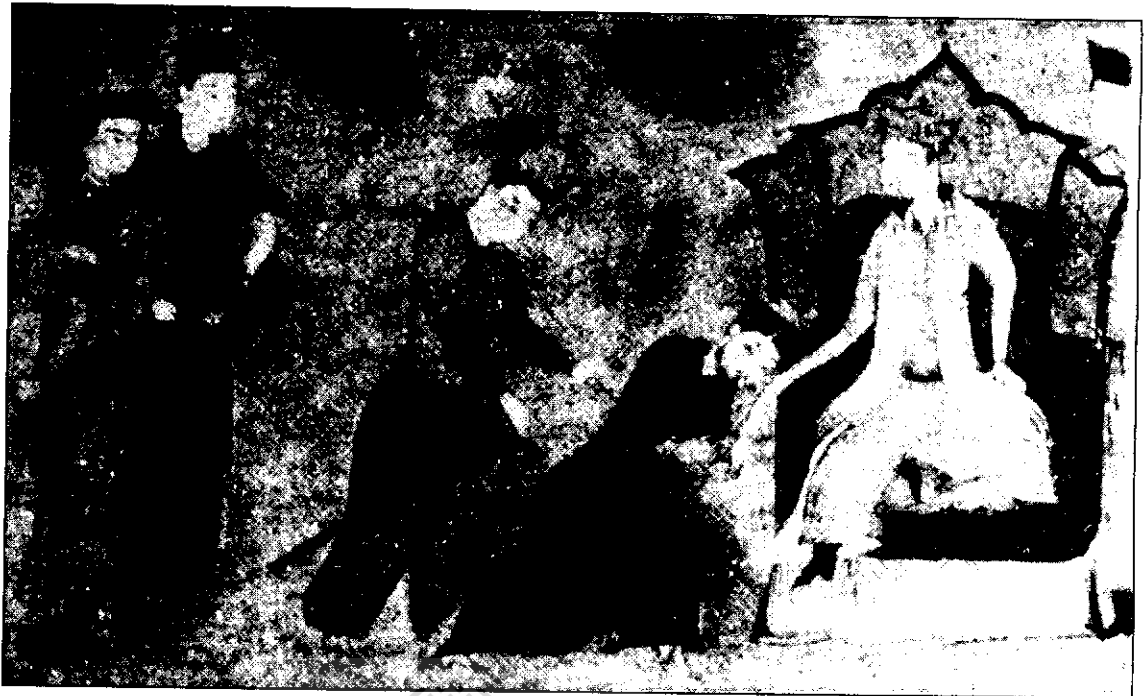
مغولان در حال برگزاری مراسم تمظیم و تکریم چنگیزخان

برتشنایدر نوشته است که چانگ چون (۱۲۲۷ - ۱۱۴۸ م.) زاهدی تائوئی بود، برخوردار از احترام فراوان برای خود و پارسایی اش. او در اوایل سده سیزده (هفتم ه) در دربارهای کین و سونگ (دوسلسله حاکم بر چین که هر دو به دست مغول سرنگون شد) بسیار معزز بود