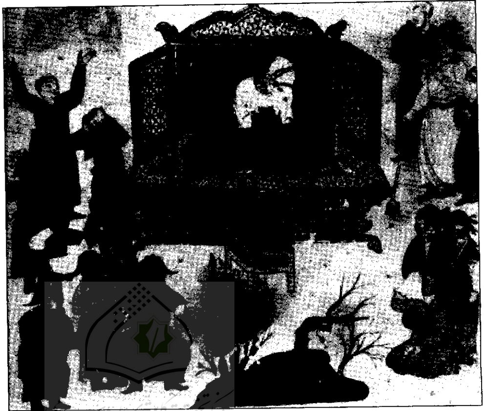
سوغاری در مقابل تابوت چنگیزخان

نامه‌های مبادله شده میان چنگیز و چانگ چون اصولی و واقع بین بودن جهانگشا و فروتنی و هوشمندی حکیم تائوئی را نشان می‌دهد