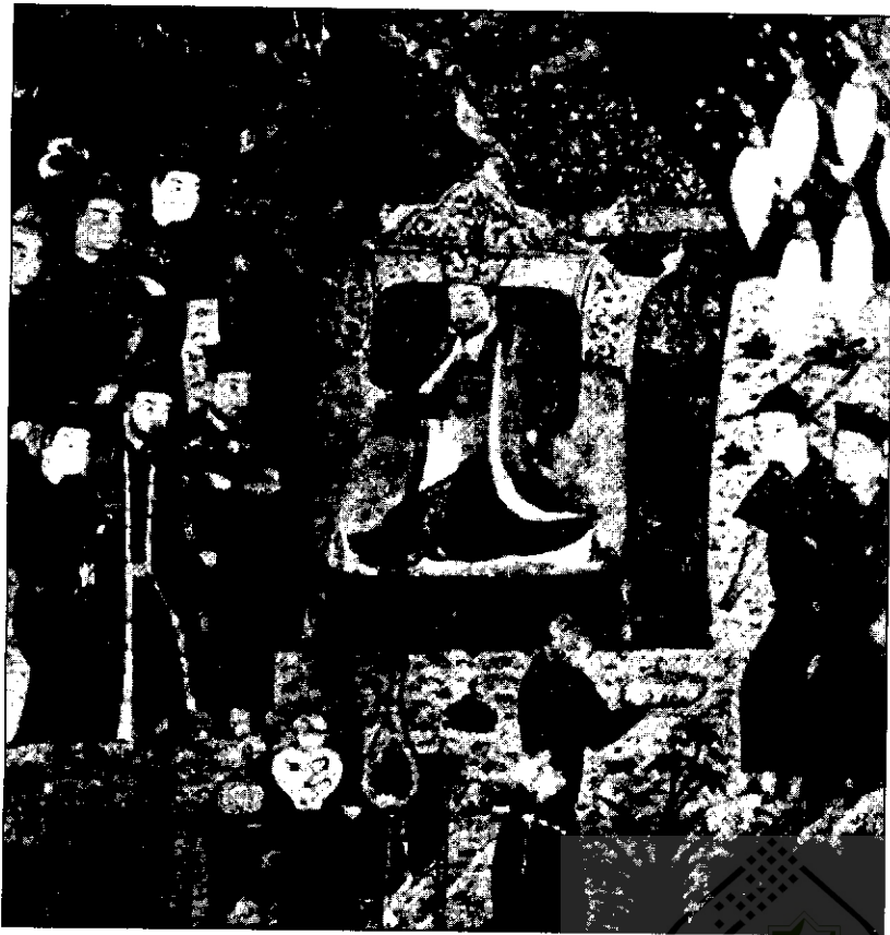
مراسم تاج‌گذاری چنگیزخان در قوریلنای در ۱۲۰۶ م.

«پیر» و همراهانش از شهرهای بیش‌بالیغ، جم‌بالیغ و المالیق گذشتند و به سمرقند رسیدند، و زمستان را آنجا ماندند. در بهار باز فرستاده‌ای از اردوی چنگیز آمد، و «پیر» از سمرقند روانه شد و فقط پنج - شش شاگرد و مرید همراهش بود. از شهر کش گذشتند، گذرگاه بلند «در آهن» یا دروازه آهن را پیمودند، از آمودریا با قایق رد شدند، و روز ۱۶ مه سال ۱۲۲۱ به اردوی چنگیز رسیدند