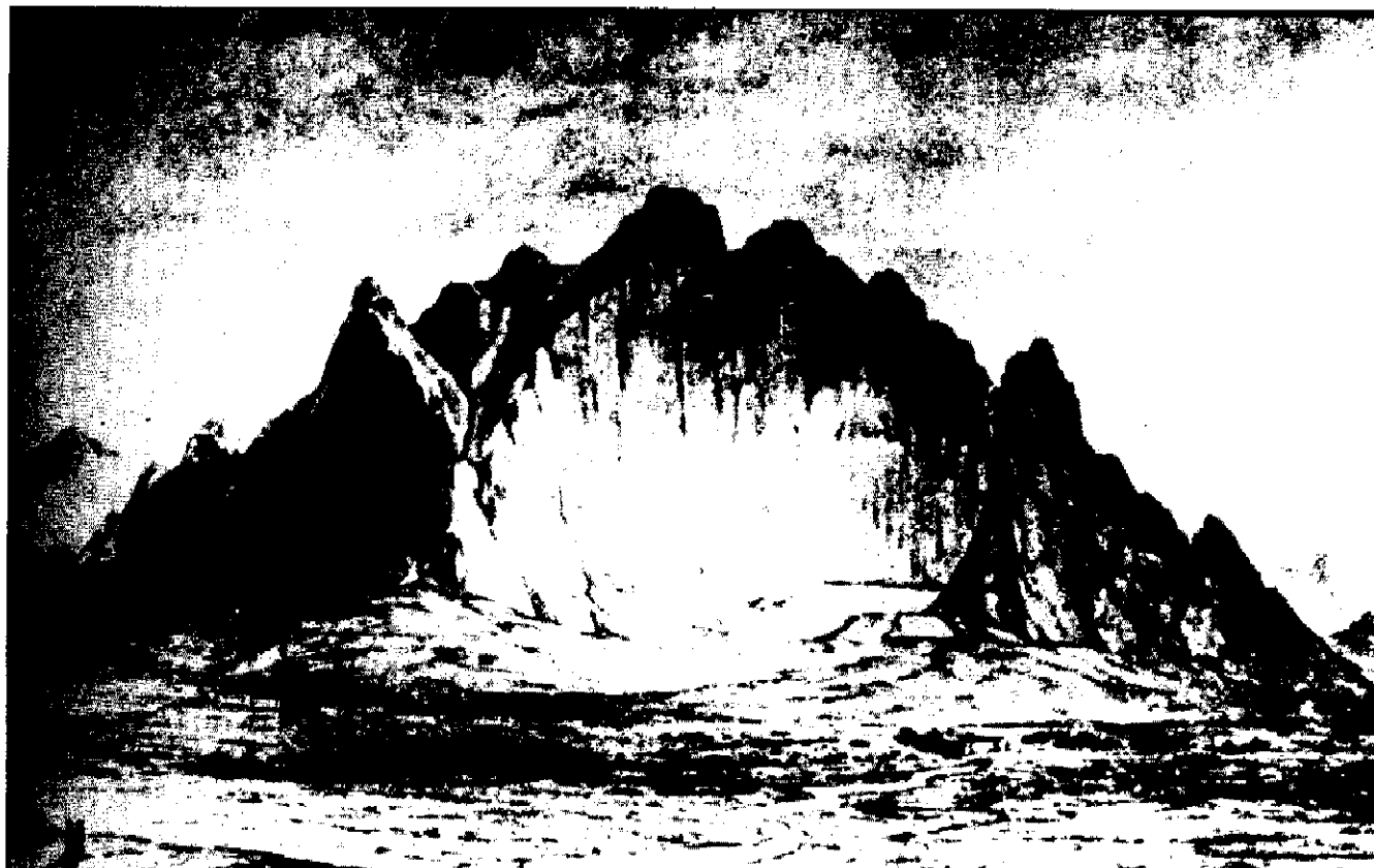
بیستون - نقاشی از لویس دو سر روبرت کرپرتر ۱۸۱۸ م. - موزه بریتانیا

تألیف کوان، چاپ اول، سال انتشار ۱۹۳۹، قیمت تخمینی ۲۵۰-۳۵۰