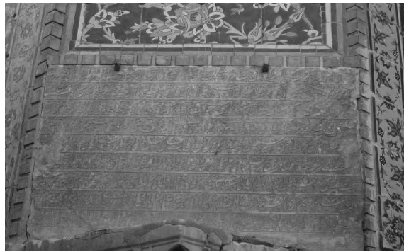
تصویر ۲- فرمان شاه عباس بر جرز شرقی ایوان جنوبی مسجد شاه اصفهان

بنیچه ۱۰ جمع هر محل وضع نمایند و [...] به رعایا نرسانیده، قلم و قدم کشیده و کوتاه دارند. سادات عظام و علمای گرام و قضات اسلام و اهالی و اعیان و ارباب و رؤسا و کدخدایان و اهل حرفت و عموم رعایای دارالسلطنه، از بلده و بلوکات، بدین عطیۀ عظاما، مبتهج ۱۱ و مسرور بوده، از روی امیدواری تمام، در لوازم دعاگوئی و دوام دولت ابد پیوند. ۱۲ (تصاویر ۱ و ۲)