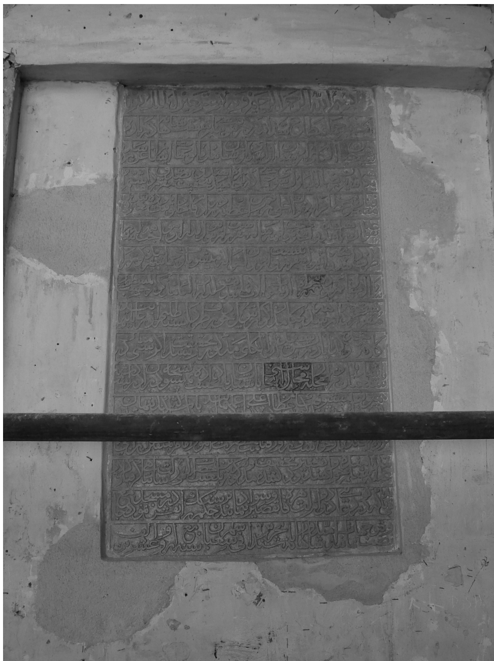
تصویر ۵- فرمان شاه عباس در مسجد جامع اردستان

شد و در آخرت در خدمت حضرت امیرالمؤمنین و امام المتقین - علیه السلام - شرمندہ خواهند بود و تغییرکننده تخفیف مذکور، به لعنت الهی و نفرین حضرت رسالت پناهی گرفتار گردد و باید که دستور دوام الشرف را بر سنگ نقش نموده، بر در مسجد جامع نصب نمایند و در دعاگوئی دوام دولت قاهره، تقصیر نکنند. فی شهر شعبان سنه اربع