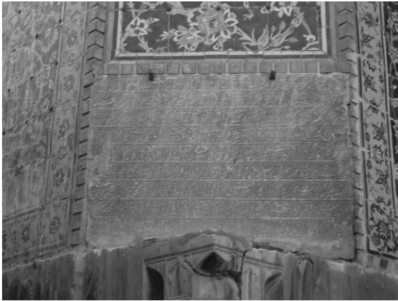
تصویر ۱- موقعیت فرمان شاه عباس بر جرز شرقی ایوان جنوبی مسجد شاه اصفهان

مطالبات دیوانیه سبکبار بوده و در مهد امن و امان آسوده فارغ‌البال ملهم توفیق ازلی و [...] به خاطر فیض مآثر پرتو انداخت که در ماه رمضان که ایام طاعات و عبادات است و شیعیان اهل بیت طیبین و طاهرین که سالکان مسالک حق و یقین [...] و ادای صوم و صلوات و وظائف طاعات و عبادات، قیام و اقدام نمایند که هر آینه ثوابت ۶ آن، به روزگار فرخنده آثار همایون ما عاید گردد. لهذا شمه [ای] از مراحم و الطاف [...] شیعیان ممالک محروسه فرموده، در کل قلمرو همایون، مالوجهات [...] رمضان المبارک - سوای جهاتی که به اجاره می دهند - تخفیف و تصدق مقرر فرموده، ارزانی داشتیم و این حکم همایونی، از مکمن ۷ [...] دارالسلطنه اصفهان - که مردم آنجا ابا عن جد از زمره شیعیان اند و حلقه اخلاص و بندگی این دودمان ولایت نشان بر گوش جان دارند - عز اصدار یافته، مستوفیان عظام دیوان [...] و ثبت نموده، از شوائب ۸ تغییر و تبدیل مصون و محروس دارند. وزرا و عمال و متصدیان مهمات دیوانی دارالسلطنه مذکوره، از ابتدای توشقان‌نیل، مالوجهات و وجوهات [...] به تخفیف و تصدق مقرر دانسته، در آن ماه مبارک - که ایام و لیالی متبرکه است - به علت حقوق دیوانی حواله و اطلاقی بر رعایا و عجزه نموده، از حشو ۹