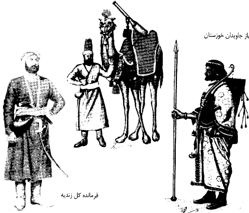
فرمانده کل زندیه

کتاب به فهم آسان مطالب دوره‌های تاریخی کمک شایانی می‌نماید بخصوص تجسم توضیحات تحولات نظامی با لحاظ این تصاویر آسان می‌گردد.