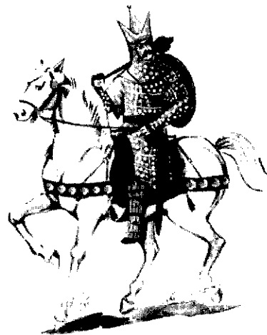
افسر سوار سنگین جنگ افزار - دوره ساسانی

با همسایگان را از دیگر مبانی نظامی این سلسله برمی‌شمارد. توصیف تمدن ماد و اثرات آن، مبحث بعدی اولین گفتار، از فصل ششم می‌باشد. گفتار دوم این فصل به بررسی قیام کوروش پرداخته و روند شکل‌گیری سلسله هخامنشیان را تشریح می‌نماید که شامل وضعیت قوم پارس قبل از برخاستن به مقابله با مادها، نبردهای این خاندان با مادها و بدست گرفتن قدرت می‌باشد. روابط کوروش با دول مجاور (بابل - لیدی و سکاها)، موضوع دیگر این گفتار است. اصلاحات داریوش و روابط داریوش با همسایگان و نیز دیگر پادشاهان هخامنشی با همسایگان و رخدادهای عمده آنان، به تفصیل در این گفتار آورده شده و به دنبال آن به وضعیت ارتش و جایگاه آن و نیز تشکیلات ارتش پرداخته شده است. مؤلفه‌های اندیشه نظامی در این دوره (هخامنشیان) از نظر مؤلف بدین‌گونه‌اند: ۱. سرعت عمل در میدان نبرد