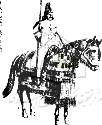
سوار سنگین جنگ افزار پارتی - دوره اشکانی

نهادهای نظامی اشکانیان و فنون نظامی آنان (تبحر در نیزه‌پرایی، تیراندازی و سوارکاری)، از دیگر موضوعات مورد بحث این گفتار است. از دیدگاه مؤلف، مؤلفه اصلی اندیشه نظامی اشکانیان، جنگ و گریز و اغفال دشمن و شورش مردمی می‌باشد. ۱ گفتار دوم این فصل به بررسی تاریخ نظامی و اندیشه نظامی در دوره ساسانی اختصاص یافته است. در این گفتار مؤلف تاریخ سیاسی و نظامی ساسانیان را به تفصیل تشریح نموده و نحوه به قدرت رسیدن آنان، اوضاع مقارن ظهور آنان (ساسانیان) و تشکیل سلسله و مخاصمات و درگیری‌های آنان با دول مجاور (اقوام بیابانگرد شمالی، رومیان و اعراب) را آورده است. اصول و مبانی اندیشه نظامی ساسانیان، همان اصول و مبانی دوران هخامنشی است با این تفاوت که ایجاد استحکامات نظامی و دفاعی که به تقلید از روم صورت گرفته بود و استفاده از ابزار و آلات قلعه کوبی در این دوره بر آنها اضافه گردیده است. وضعیت ارتش و تشکیلات نظامی و جایگاه