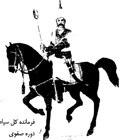
فرمانده کل سپاه دوره صفوی

مورد بحث می‌باشند. مبنای اندیشه نظامی در دوره قاجار: ۱- درباره گرای ۲. بیگانه‌گرایی ۳. وابستگی، مؤلف درباره دو اصل بیگانه‌گرایی و وابستگی در بررسی ارتش ایران در این دوره، به تفصیل بحث نموده است. اندیشه نظامی امیرکبیر که از دو اصل بنیچه ۳۳ و بدل ۳۴ تشکیل شده، در ادامه این فصل آورده شده است.